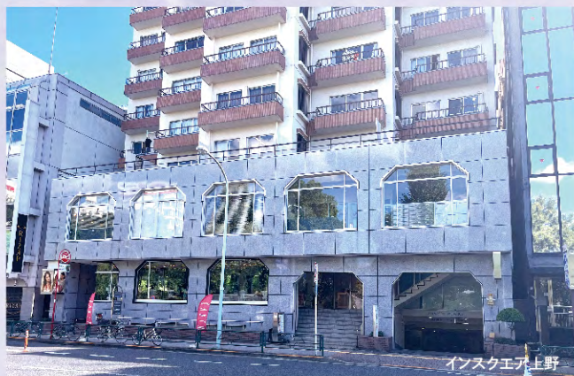
インスクエア上野